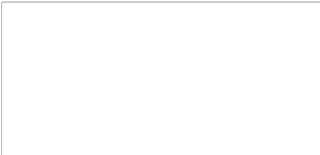
Společná fotografie účastnic kurzu pečení medocukrového pečiva z roku 1932.